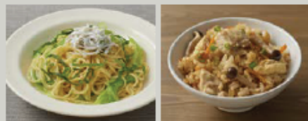
しらすと大葉のアーリオオーリオ 鶏ときのこの炊き込みごはん