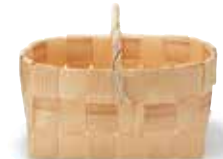
Pine Basket with Handle

[02543198] L Approx. W 27 x D 27 x H 9 cm $73