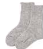
Wool Blend Room Socks $53

[02543167] Sakkola Approx. W 2.2 cm x L 1 m