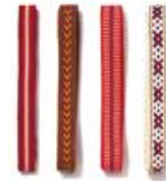
Traditional Pattern / Ribbon $29

[02543174] Approx. W 40 x D 30 x H 29 cm (incl. handle) $109