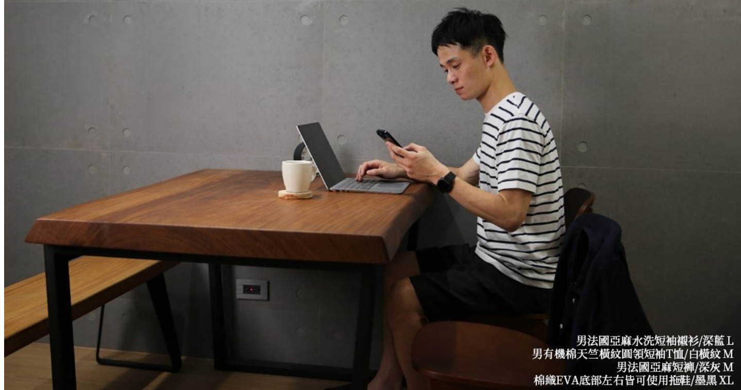
男法國亞麻水洗短袖襯衫/深藍 L 男有機棉天竺橫紋圓領短袖T恤/白橫紋 M 男法國亞麻短褲/深灰 M 棉纖EVA底部左右皆可使用拖鞋/墨黑 XL

在家工作或許已是不少人的日常了， 可以穿上短袖、短褲，但偶爾也有視訊會議， 一件短袖襯衫可以輕鬆而不隨性， 深色系的搭配更能營造專業沉穩的印象。