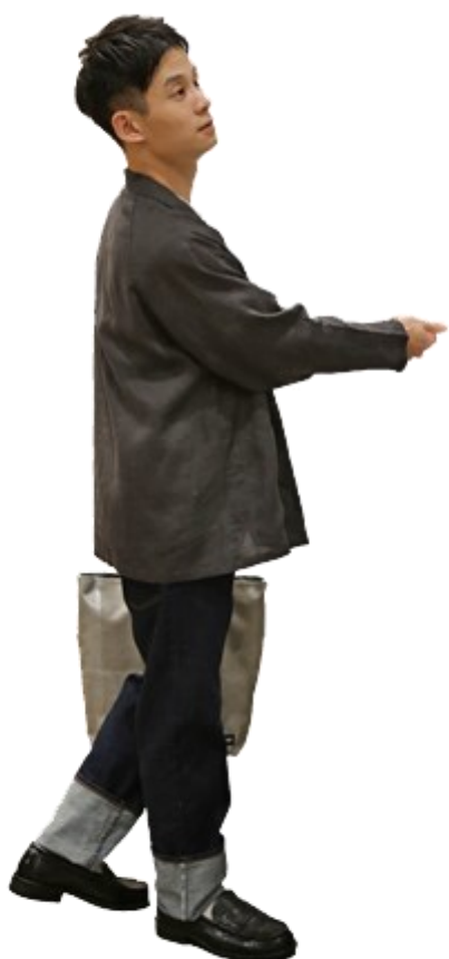
男法國亞麻水洗襯衫外套/深灰 M 男有機棉粗織天竺縫邊短袖T恤/白色 M 男有機棉混彈性丹寧直筒褲/ 暗藍 30吋