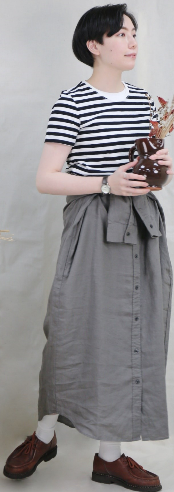
女有機棉天竺圓領短袖T恤/白直紋 M 女有機棉天竺圓領短袖T恤/白色 S 女法國亞麻水洗立領洋裝/灰白 XS-S

以灰白色立領洋裝統整調性，隨意地繫在腰間 作為裙款與上身的橫紋T恤帶出自然不造作的優雅風格。 樂在工作也盡情生活，自信又專業地創作花藝作品。