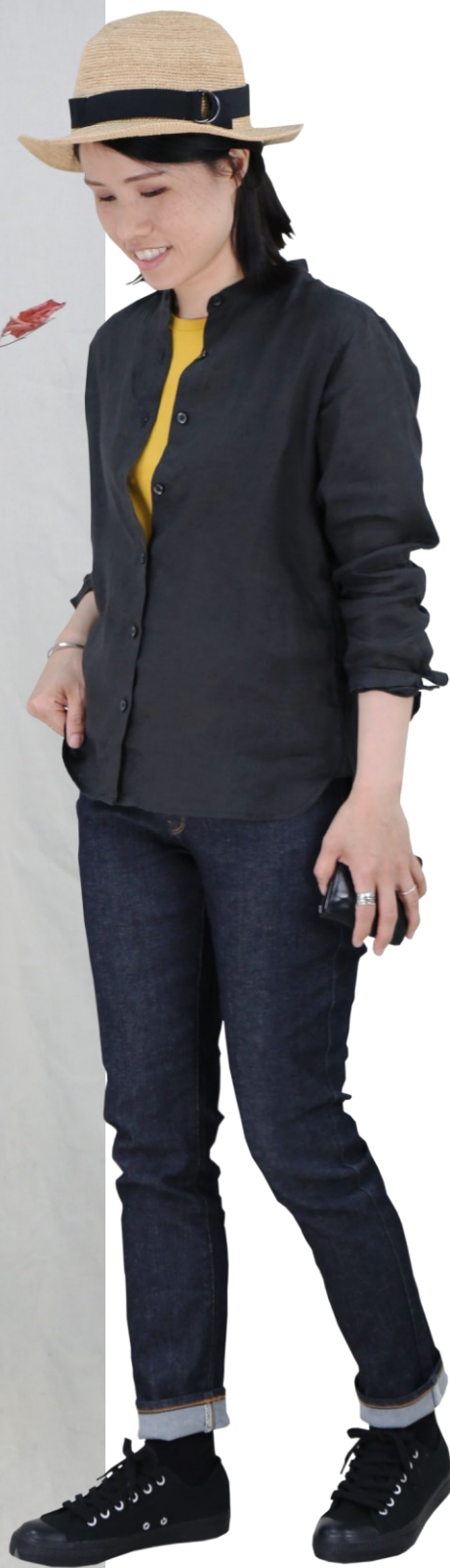
女有機棉天竺圓領短袖T恤/煙燻黃 M 女有機亞麻水洗立領襯衫/深灰 M 女有機棉縱橫混彈性丹寧合身直筒九分褲/暗藍 24inch 女撥水加工有機棉舒適休閒鞋/黑色(黑底) 椰纖編織可摺疊紳士帽/原色

整體以黑、暗藍色調作為視覺主軸，加入鮮豔飽和的 煙燻黃，營造和諧又強烈的視覺效果；搭配帶有夏日 氣息的椰編帽點綴，在參加露營祭時更顯個人特色。