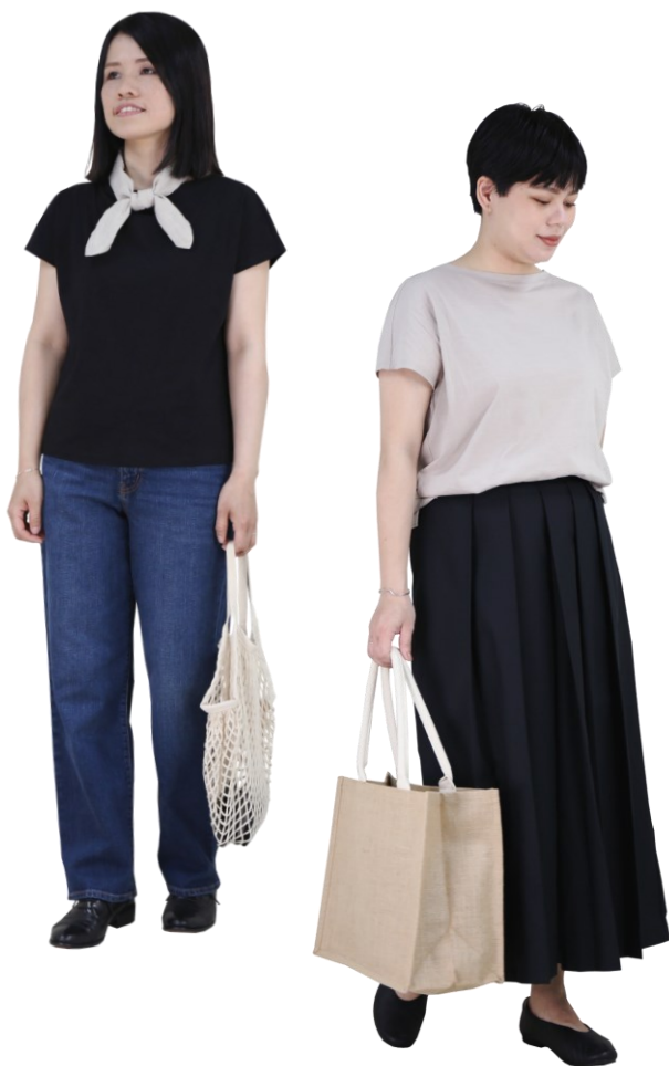
女有機棉節紗天竺法式袖T恤/黑色 M 女有機棉混彈性丹寧舒適寬擺褲/靛藍 25inch 法國亞麻附口袋領巾/原色