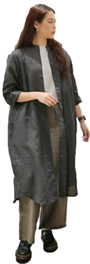
女法國亞麻水洗立領洋裝/深灰 M~L 女有機棉節紗天竺法式袖T恤/淡綠 L 女法國亞麻直筒褲/煙燻綠 L