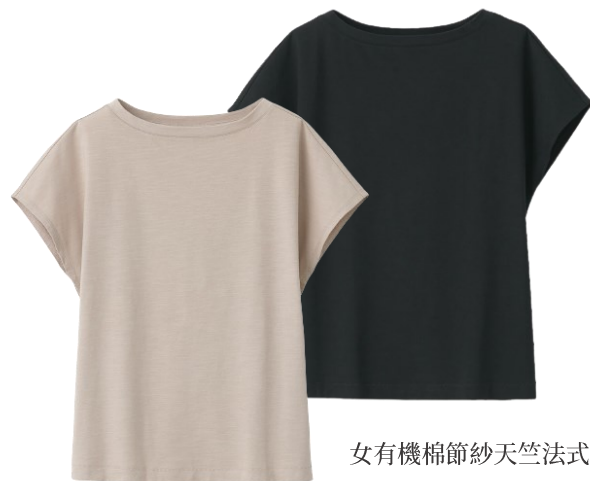
女有機棉節紗天竺法式袖T恤