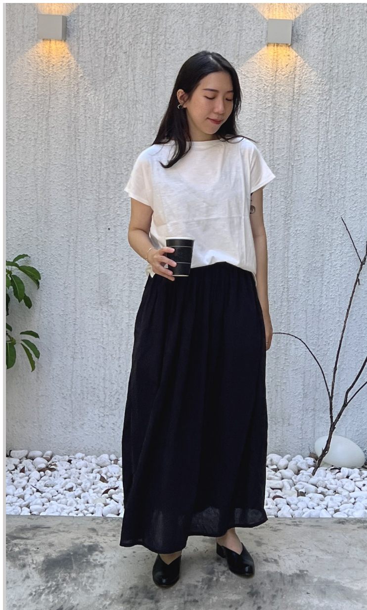
FRENCH MOOD 「法式風格」

「Elegant is refusal！」省去多餘綴飾，搭配的巧思愈是重要；選擇寬鬆版型留有適當鬆份搭配蓬鬆的強撚長裙與V字穆勒鞋，展現剛好的優雅。