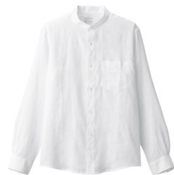
\ 男法國亞麻水洗立領襯衫 /