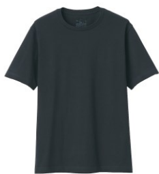
\ 男有機棉天竺圓領短袖T恤 /