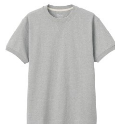
\ 男有機棉粗織天竺縫邊短袖T恤 /