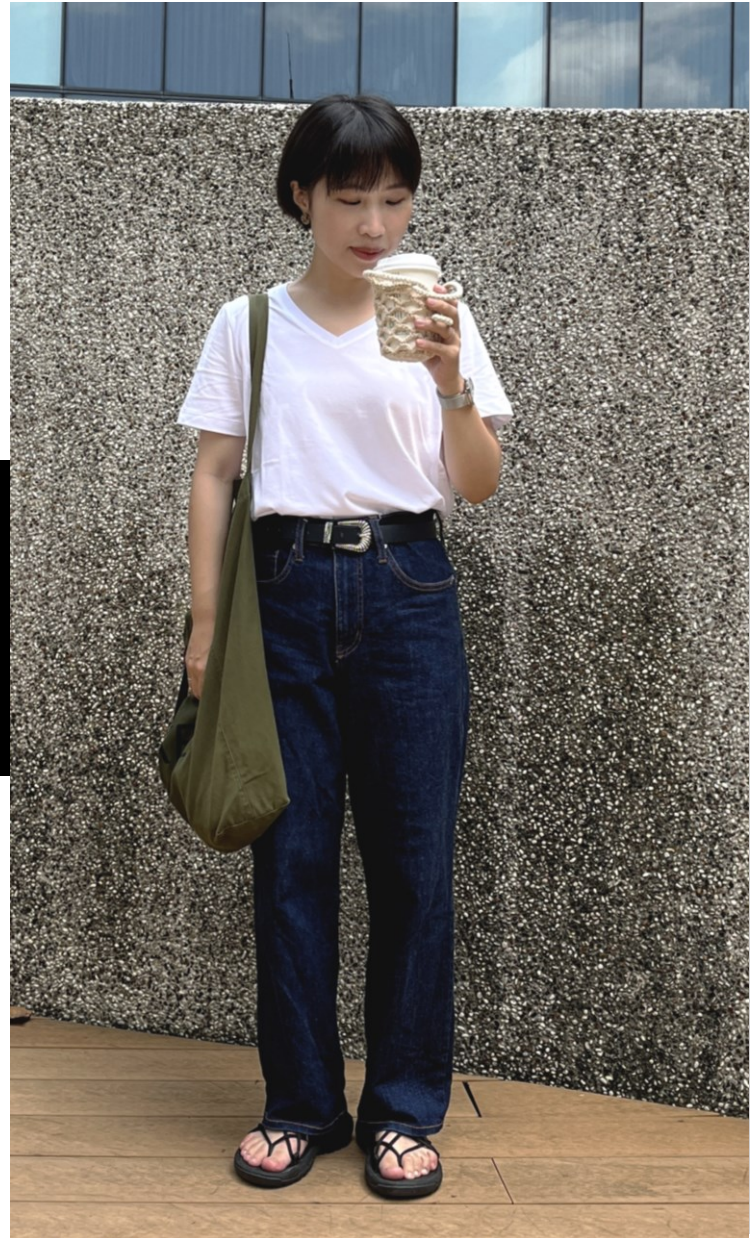
WITH DENIM PANTS 「和丹寧褲搭配」

女有機棉柔滑寬版T恤/白色 M-L 女有機棉混縱橫彈性綾織舒適boy fit九分褲/黑色 M