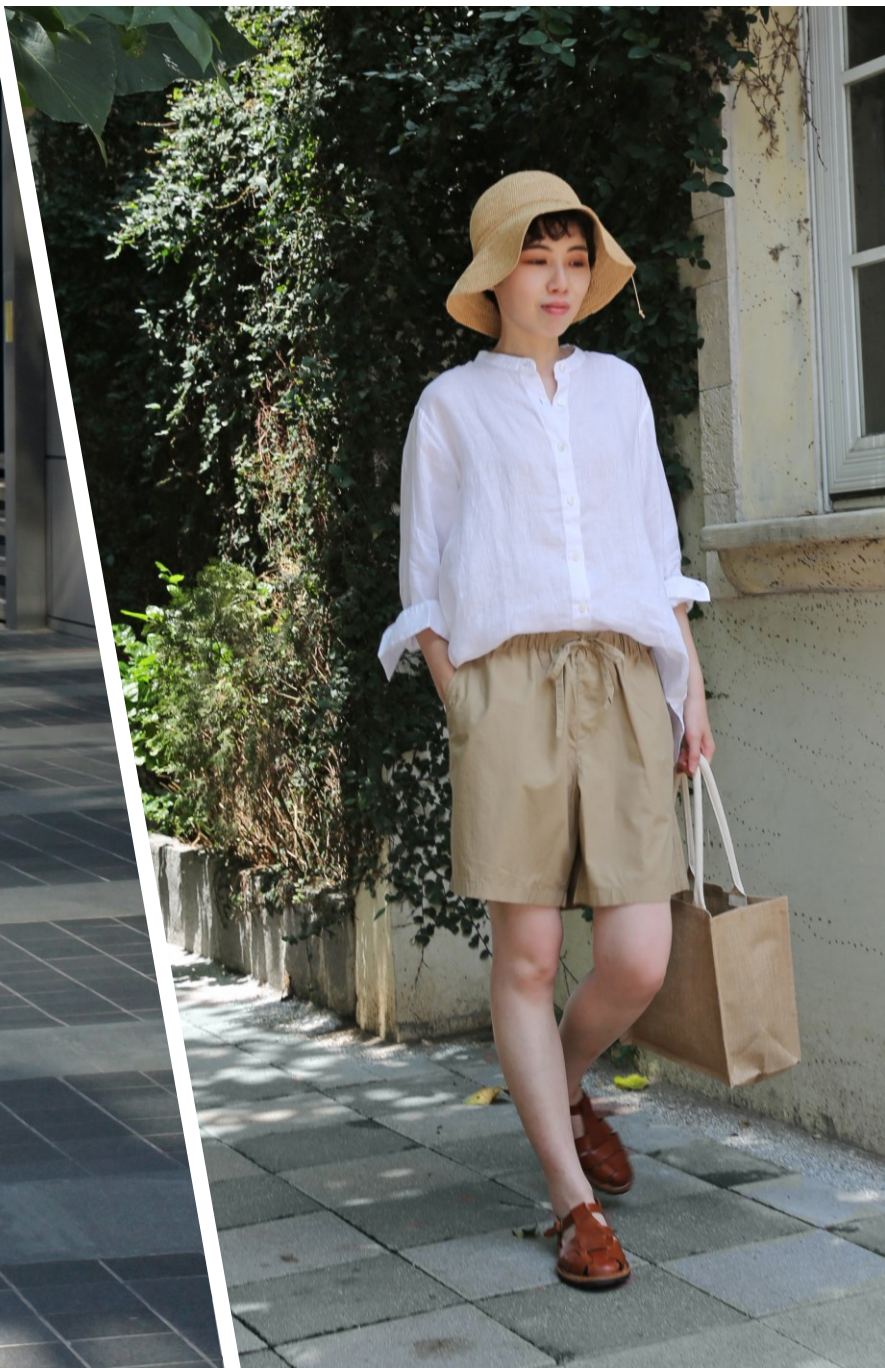
Personal Style | Basic 知性穩重

單色調的沈穩及直接，簡潔俐落、不需要過多的裝飾， 基本的版型更能襯托出獨特個性的妳。