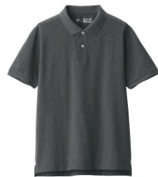
\ 男有機棉水洗鹿子織短袖POLO衫 /

鹿子織POLO衫使用雙撚紗線織成，增加了面料的堅韌度，單穿時也不用煩惱會透膚；布料表面凹凸織面紋理，能減少肌膚接觸的面積。