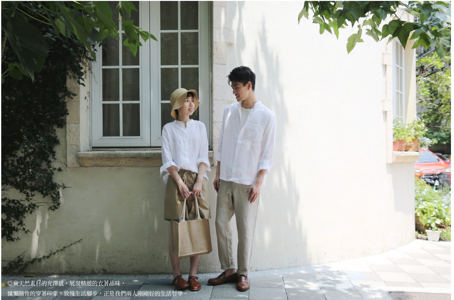
亞麻天然素材的光澤感，展現精緻的衣著品味， 慵懶隨性的穿著印象，放慢生活腳步，正是我們兩人剛剛好的生活哲學。