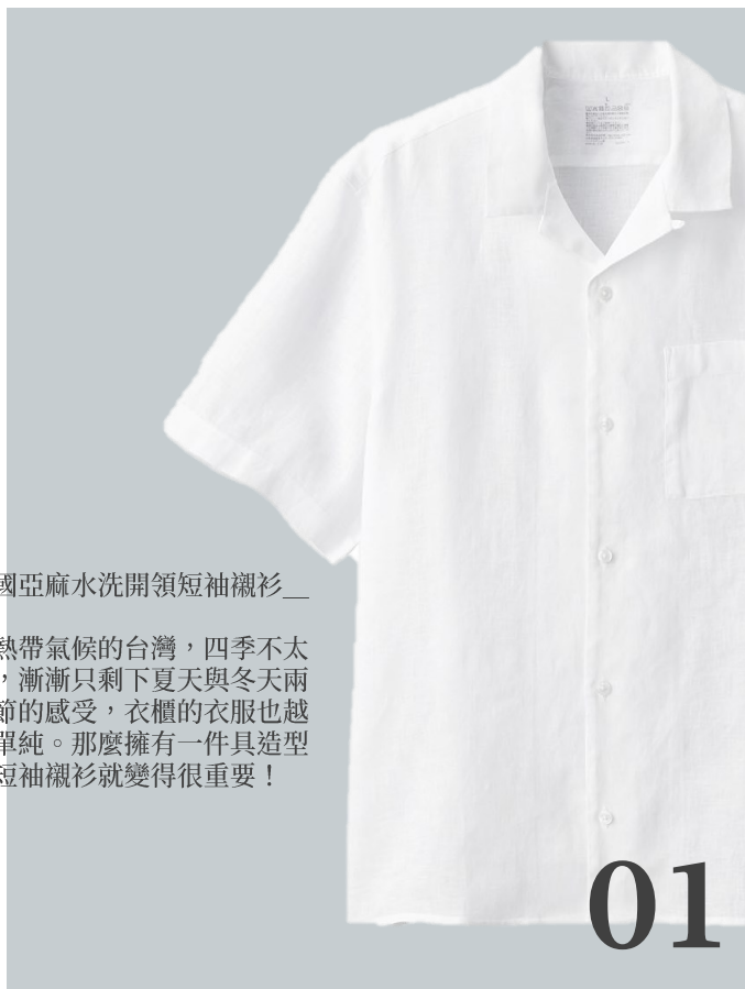
男法國亞麻水洗開領短袖襯衫__

在副熱帶氣候的台灣，四季不太分明，漸漸只剩下夏天與冬天兩個季節的感受，衣櫃的衣服也越來越單純。那麼擁有一件具造型感的短袖襯衫就變得很重要！