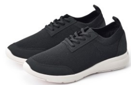
\ 聚酯纖維足跟緩衝運動鞋 /

吸汗速乾的T恤，同時具有抗UV的機能，可延長在陽光下的活動時間；彈性布料與無肩線的設計，不論做任何運動都能活動自如。