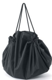
\ 聚酯纖維可攜式束口購物袋 /

織帶設計能輕鬆調節穿著舒適度，不受限於靜、動態活動，腳跟加厚的設計提升穿著時的避震緩衝。