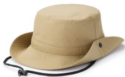
\ 撥水加工附防水膠條有簷帽 /

藍色與綠色是具有十足新鮮感的撞色配色， 搶眼的視覺印象，由內而外的展現陽光男孩的開朗個性。