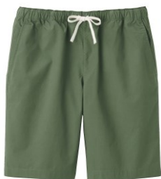
\ 男有機棉水洗平織布短褲 /

為晴雨兩用的配件，帽子內側有防水膠條設計及表面防潑水加工，就算突然下小雨也不用擔心！