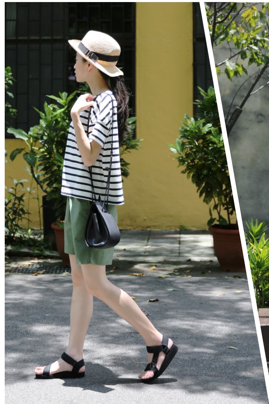
Personal Style | Bright 活潑朝氣

妳給人隨和、有活力的印象，更加注重衣服的舒適性，形象鮮明的妳，可以嘗試穿著色彩豐富的搭配。