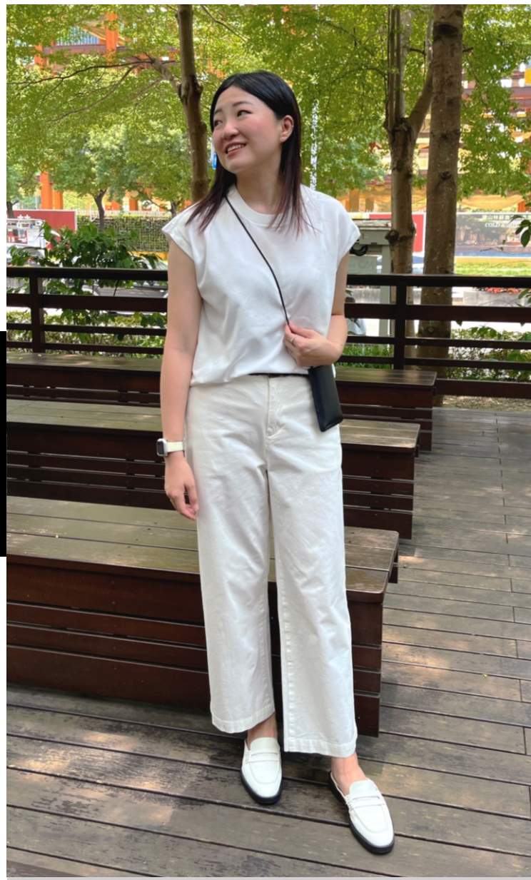
ALL WHITE 「同色的俐落感」

在夏日穿著白色服飾給人清爽潔淨的印象，並運用聚酯纖維素材獨有的光澤與皮革配件提升休閒衣著的高級感。