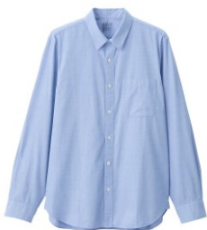
\ 男有機棉水洗平織布襯衫 /

100%棉素材，恰到好處的厚度， 單穿內搭兩相宜，簡單的紋樣在 視覺上也很清爽宜人。