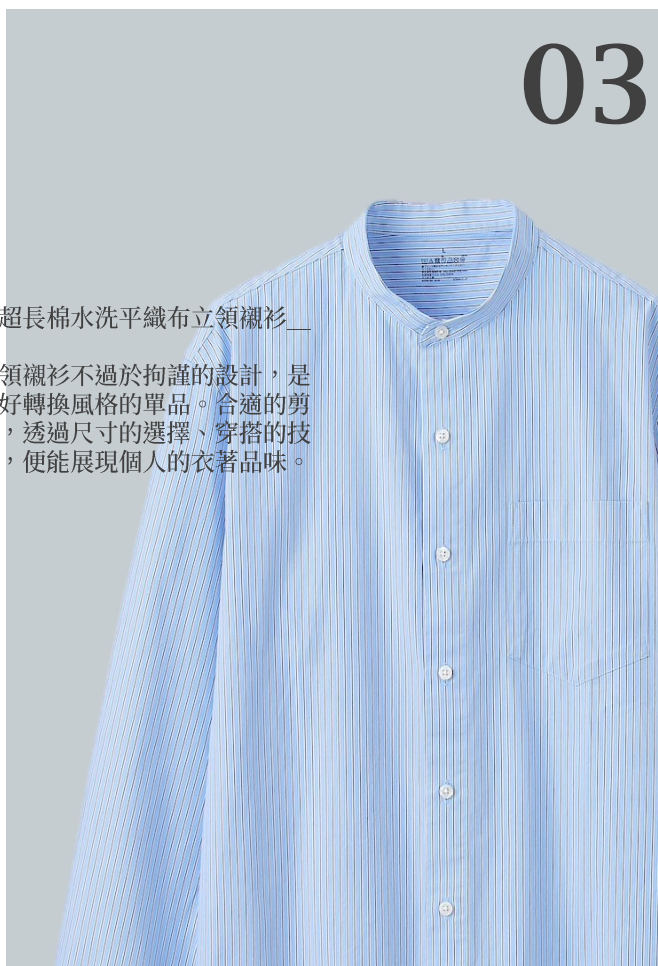
男超長棉水洗平織布立領襯衫__

立領襯衫不過於拘謹的設計，是很好轉換風格的單品。合適的剪裁，透過尺寸的選擇、穿搭的技巧，便能展現個人的衣著品味。