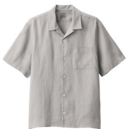
\ 男法國亞麻水洗開領短袖襯衫 /

中性色給人沉穩而堅定的印象，整體以灰色統整穿搭，有著似於套裝的衣著感，搭配簡約設計的開領襯衫，展現具有個人風格的好品味。