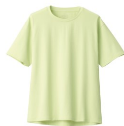
\ 抗UV吸汗速乾聚酯纖維短袖T恤 /

吸汗速乾的T恤，同時具有抗UV的機能，可延長在陽光下的活動時間；彈性布料與無肩線的設計，不論做任何運動都能活動自如。