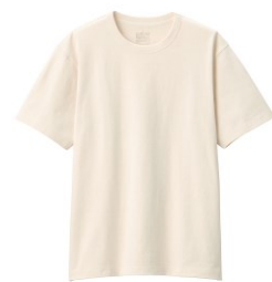
\ 男有機棉粗織天竺短袖T恤 /