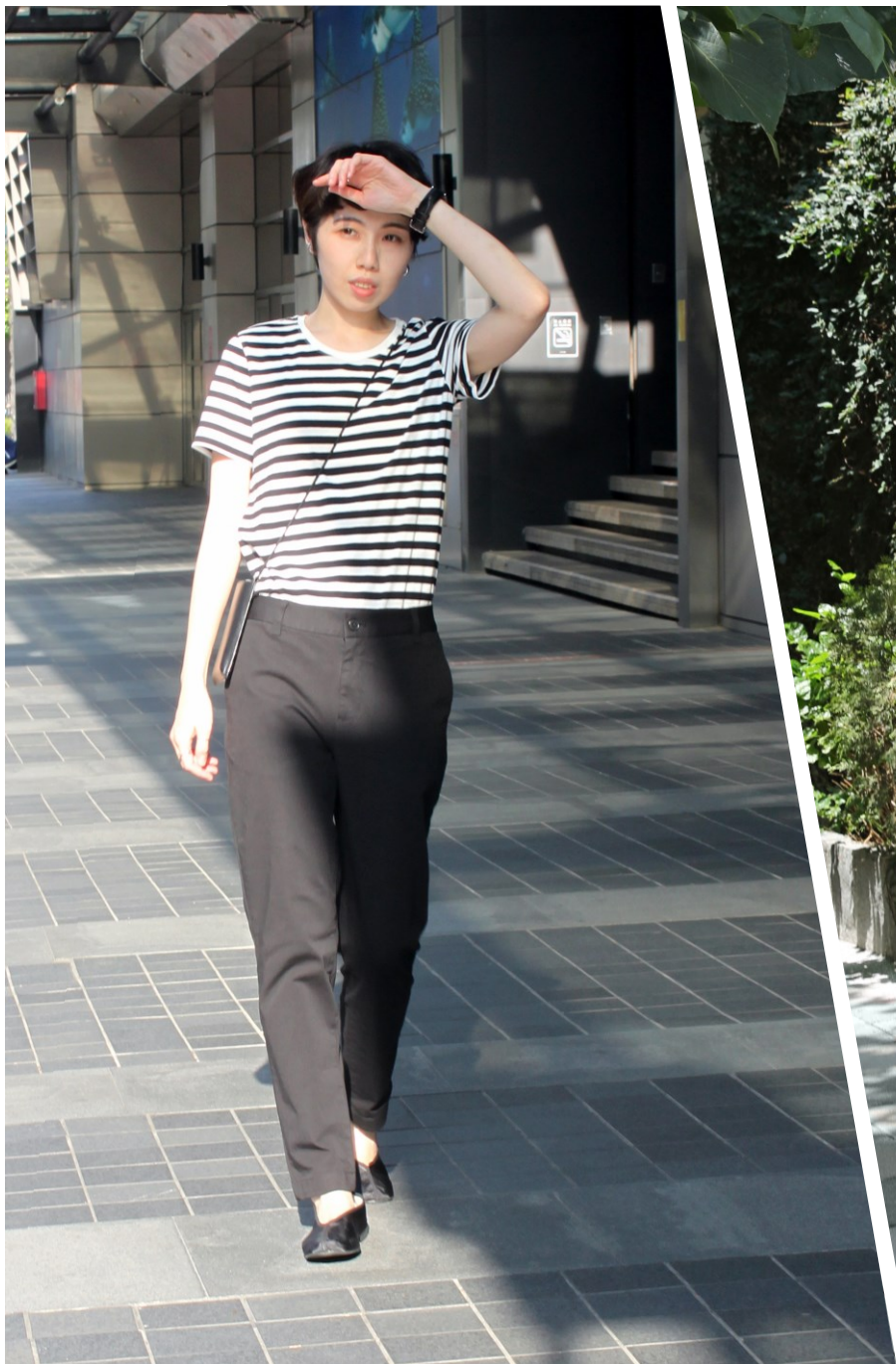
Personal Style | Trendy 都會洗鍊

在節奏鮮明的城市中，動與靜之間的明快切換， 總是優雅而具有韌性，繁生出時間的軌跡、 豐富了生活體驗， 也更貼近了屬於自己最舒心的女性樣貌。