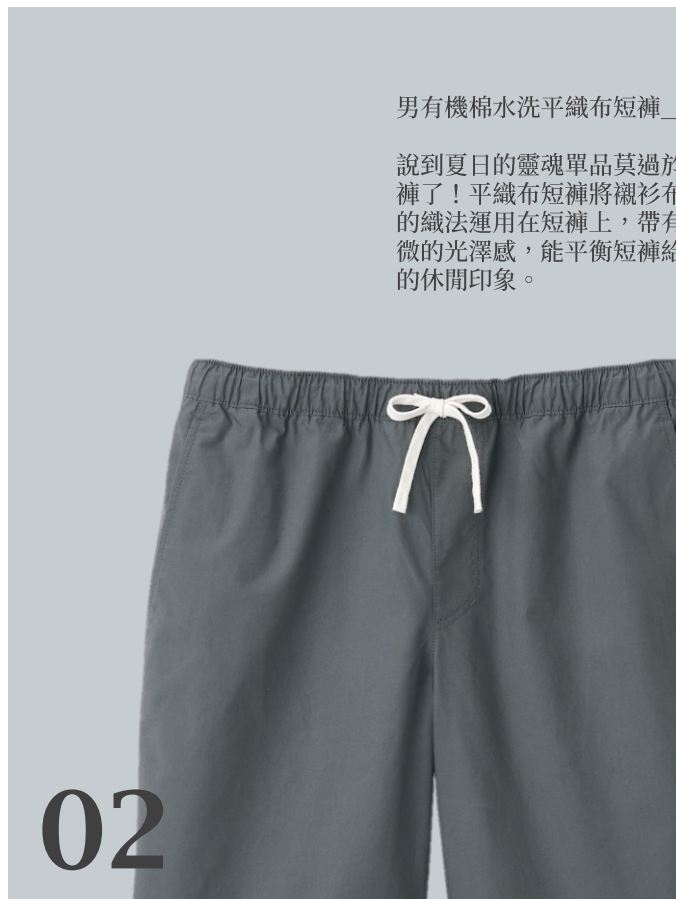
男有機棉水洗平織布短褲__

說到夏日的靈魂單品莫過於短褲了！平織布短褲將襯衫布料的織法運用在短褲上，帶有微微的光澤感，能平衡短褲給人的休閒印象。