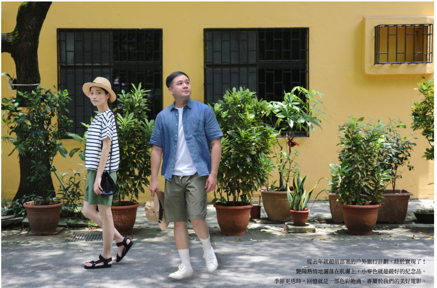
從去年就超前部署的戶外旅行計劃，終於實現了！ 艷陽熱情地灑落在肌膚上，小麥色就是最好的紀念品。 季節更迭時，回憶就是一部色彩飽滿、專屬於我們的美好電影。