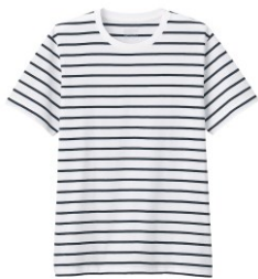
\ 男有機棉天竺橫紋圓領短袖T恤 /

以藍色為主的相似色堆疊出層次分明的搭配， 輕盈的配色也能讓整體視覺增添爽朗明亮的氛圍，展現舒適的休閒穿搭。