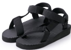
\ 織帶可調波浪海綿涼鞋 /

日常例行採買時總不會忘記確認家人需要添購哪些常備品，默默地貼心付出，大地色澤的自然紋理，與你質樸的個性一樣，總是多一分含蓄內斂的溫柔。