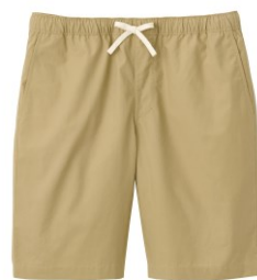
\ 男有機棉水洗平織布短褲 /