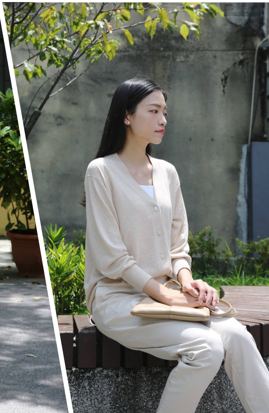
Personal Style | Elegant 氣質優雅

妳給人隨和、有活力的印象，更加注重衣服的舒適性，形象鮮明的妳，可以嘗試穿著色彩豐富的搭配。